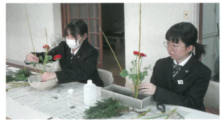
日本文化研究部(生花)