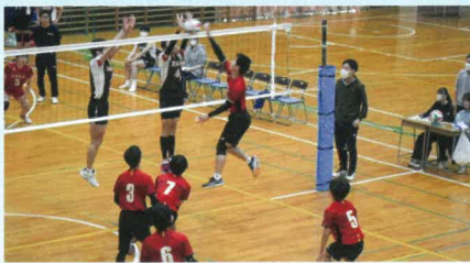
バレーボール部【男】