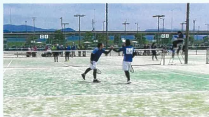
ソフトテニス部【女】