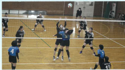
バレーボール部【女】