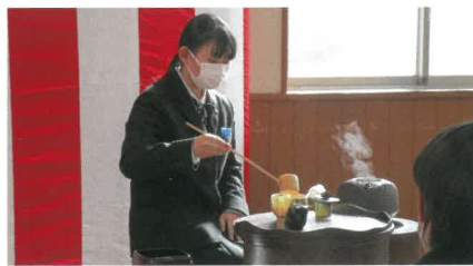
日本文化研究部(茶道)