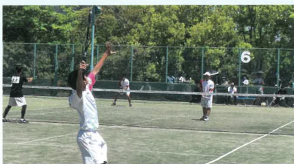
ソフトテニス部【男】